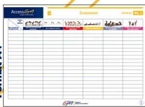
10 Fiches d'évaluation