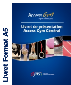
1 Livret de présentation

La pratique des disciplines gymniques requiert une formation de base solide permettant de construire d'autres apprentissages plus complexes. La Fédération Française de Gymnastique a développé une mallette pédagogique permettant de proposer à tous les jeunes gymnastes à partir de 6 ans un accompagnement « made in FFG » adapté selon leurs motivations et leurs objectifs les menant vers une pratique gymnique compétitive ou de loisir.