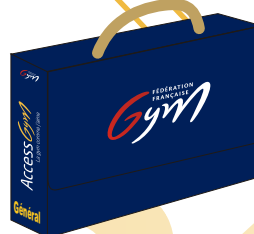
1 Valisette cartonnée