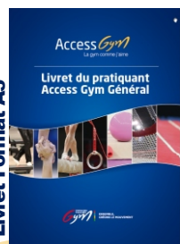
1 Livret du pratiquant