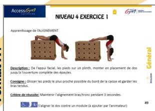
161 Fiches d'atelier